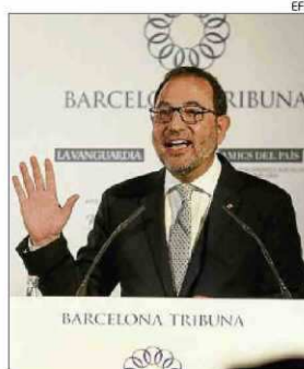
Espadaler va reclamar diàleg.

Fonts del Govern català recorden que el Consell de Garanties Estatutàries –òrgan consultiu català