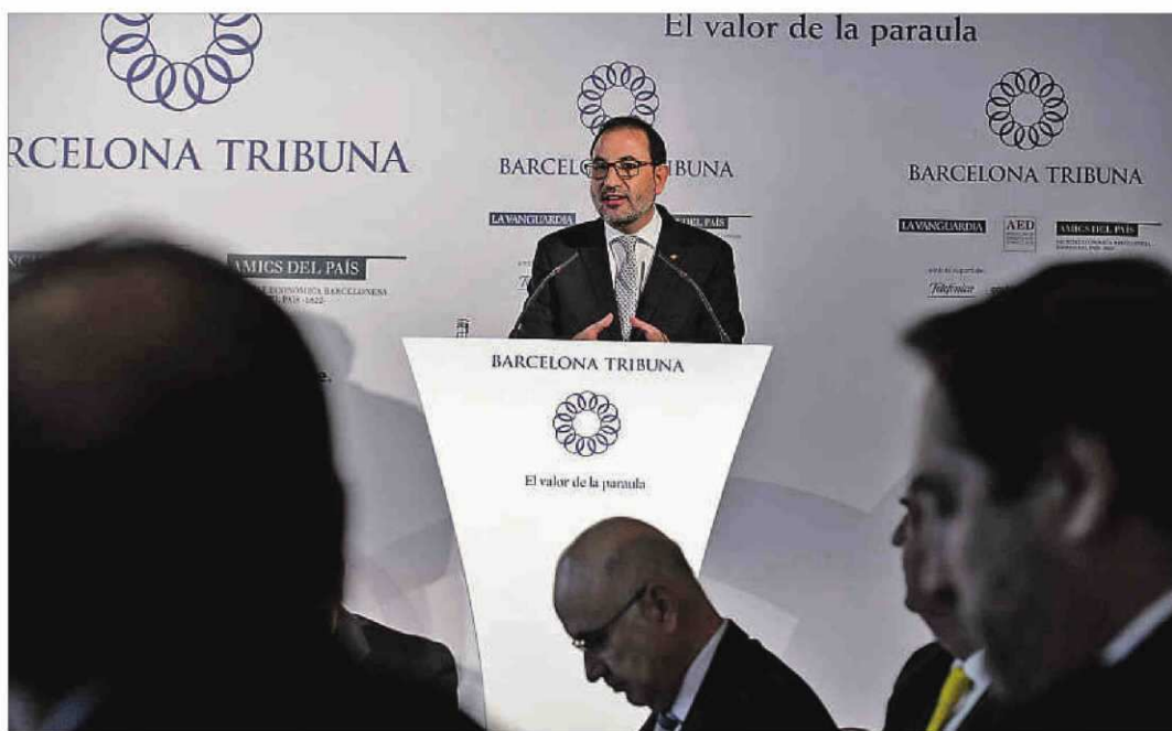
Ramon Espadaler, secretario general de UDC, analizó en Barcelona Tribuna la consulta interna de su partido sobre el proceso catalán